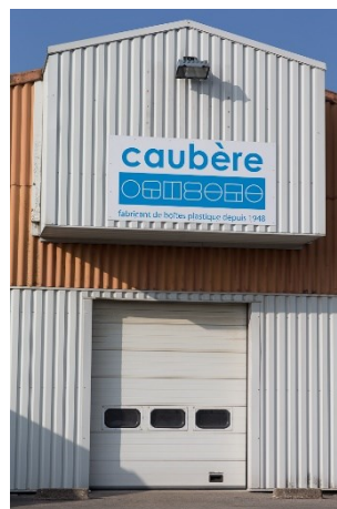
L'usine de Caubère est située à Yèbles

La conversion des entreprises au Développement Durable n'est plus une alternative, mais une nécessité. Plutôt que de l'appréhender comme une contrainte, les entreprises peuvent en faire un atout majeur, sources d'économies, d'innovation, de compétitivité, donc de pérennité. Grâce au programme « PME et développement durable en Seine et Marne », Seine-et-Marne Développement a déjà accompagné une quarantaine d'entreprises dans la définition d'une stratégie et l'engagement d'actions concrètes.